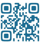
D ひざベルト・マッスルベルトの 外し方