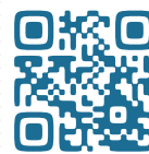
F サイドアップベルトのご紹介