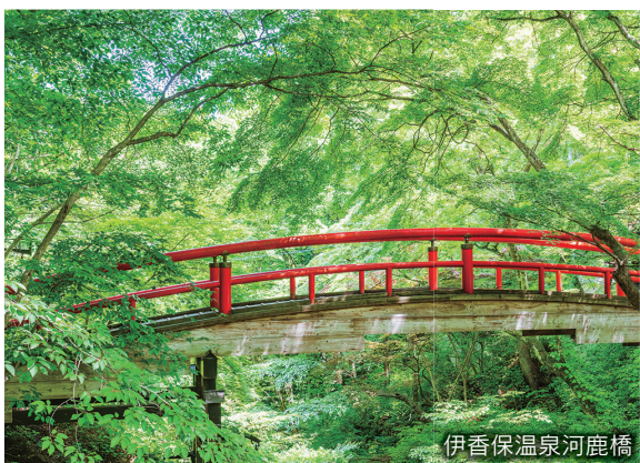
伊香保温泉河鹿橋