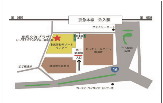
■横須賀市産業交流プラザ 京浜急行 汐入駅 徒歩1分