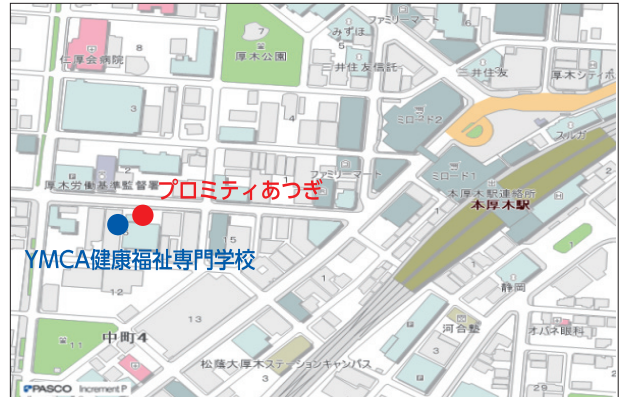
■プロミティあつぎ 小田急 本厚木駅 徒歩5分