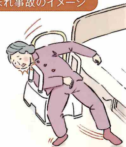
はさまれ事故のイメージ

弊社が1996年10月から2002年6月までに製造・販売したポータブルトイレの一部で、転倒などの際にひじ掛けと背もたれのすき間に頸部をはさまれた事故(死亡2件含む)が発生しました。